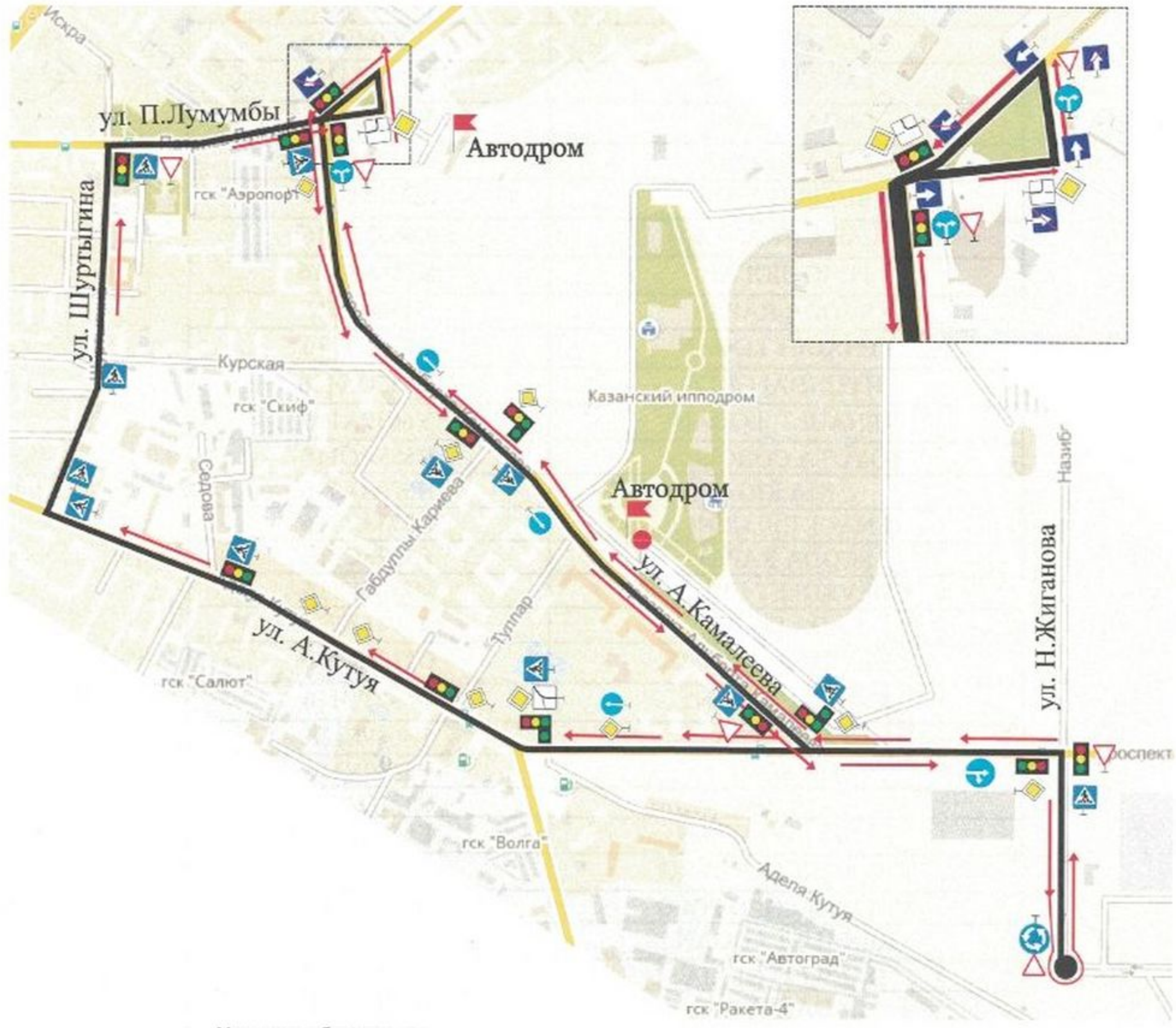
Схема учебного маршрута №3