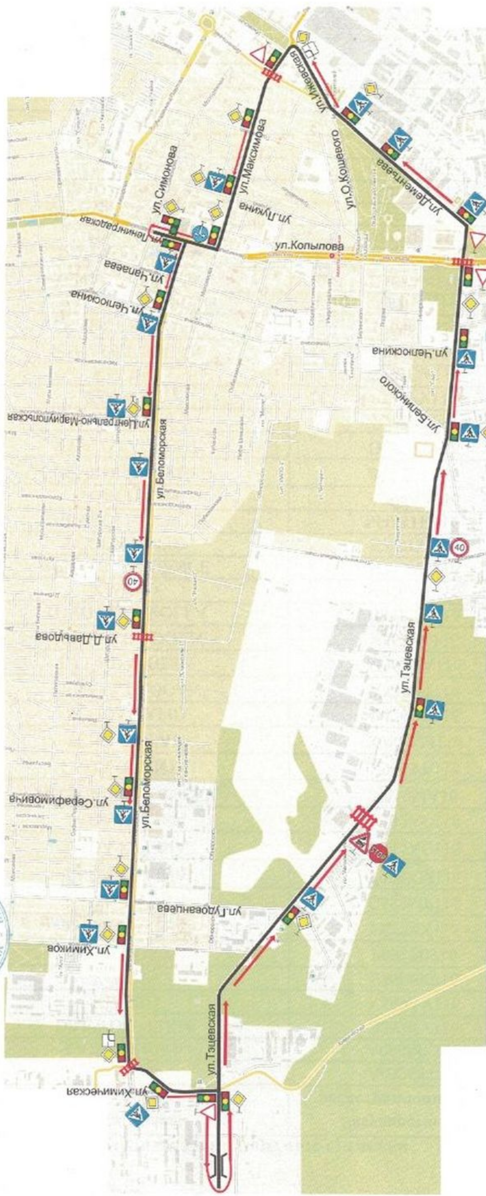
Схема учебного маршрута №10