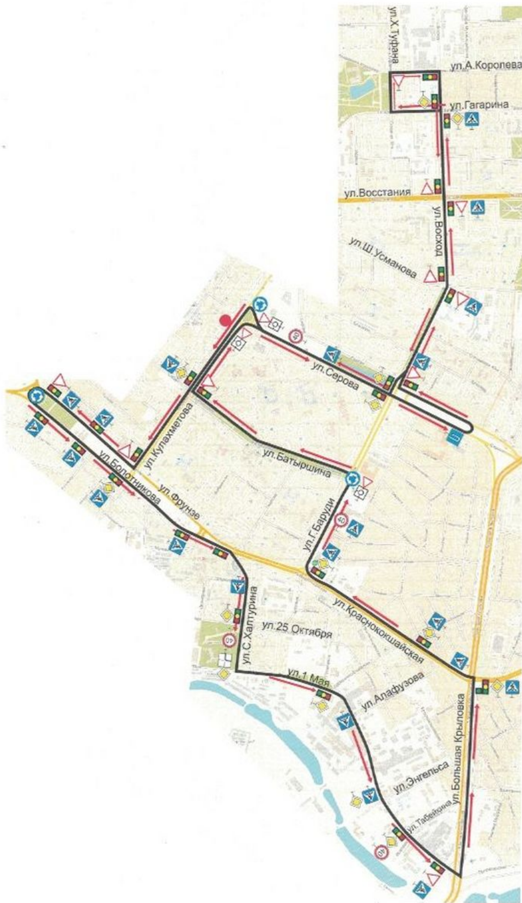
Схема учебного маршрута №11

Период действия с "01" 09 2021 г. по "31" 12 2021 г.