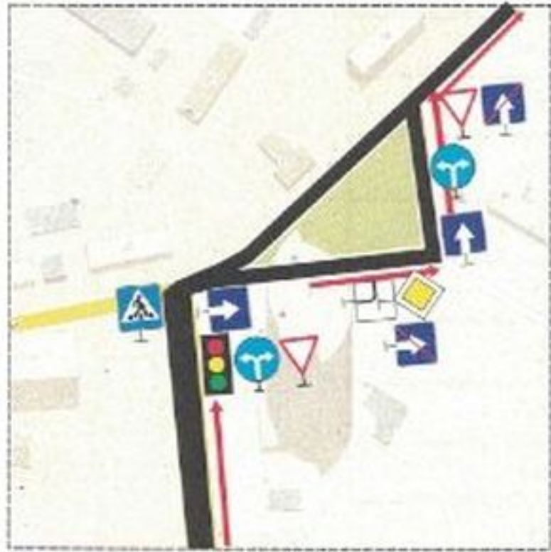
Схема учебного маршрута №2

Период действия с "01" 01 2021 г. по "31" 12 2021 г.