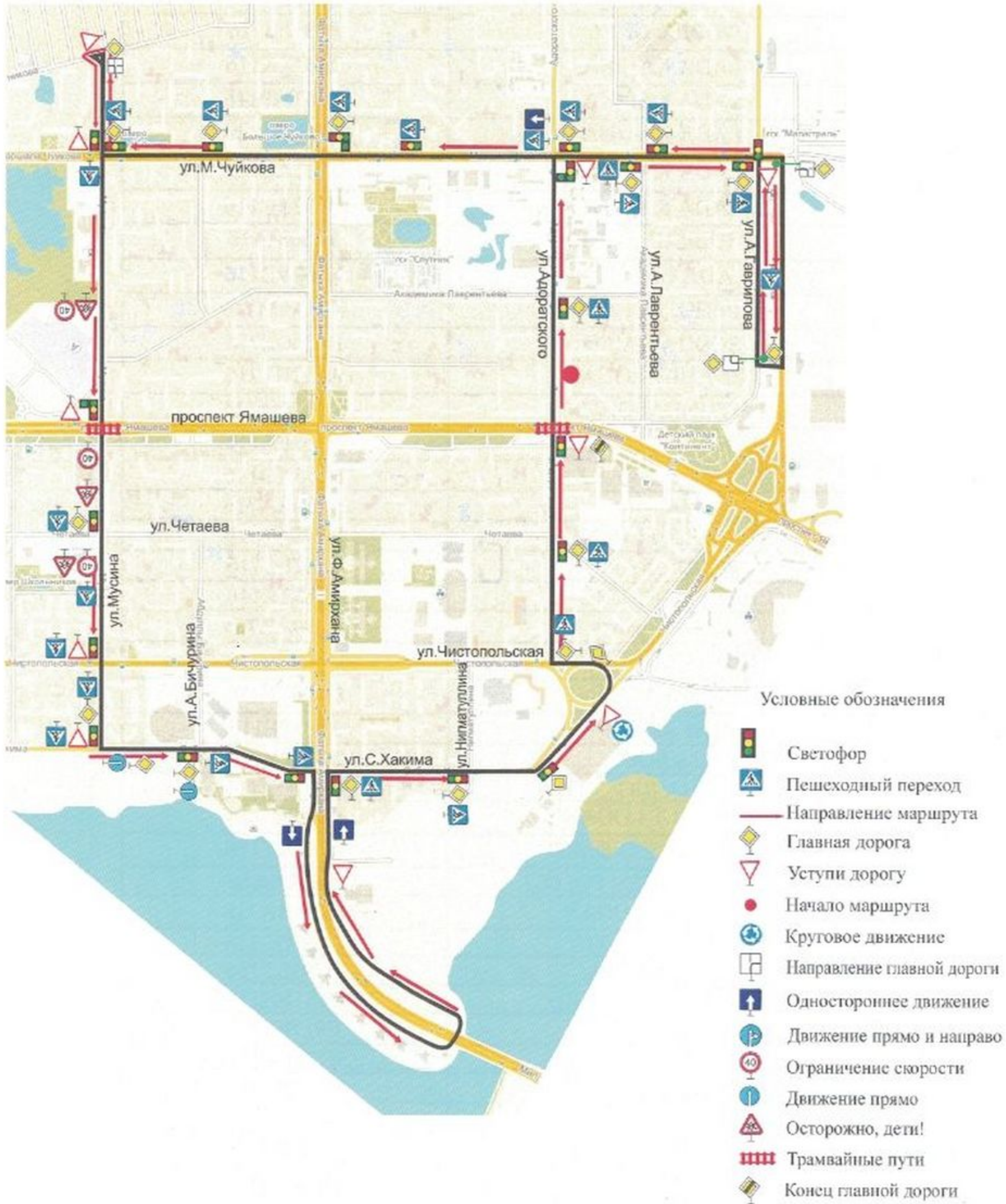
Схема учебного маршрута №8

с "01" "11" 2021 г. по "31" "12" 2021 г.