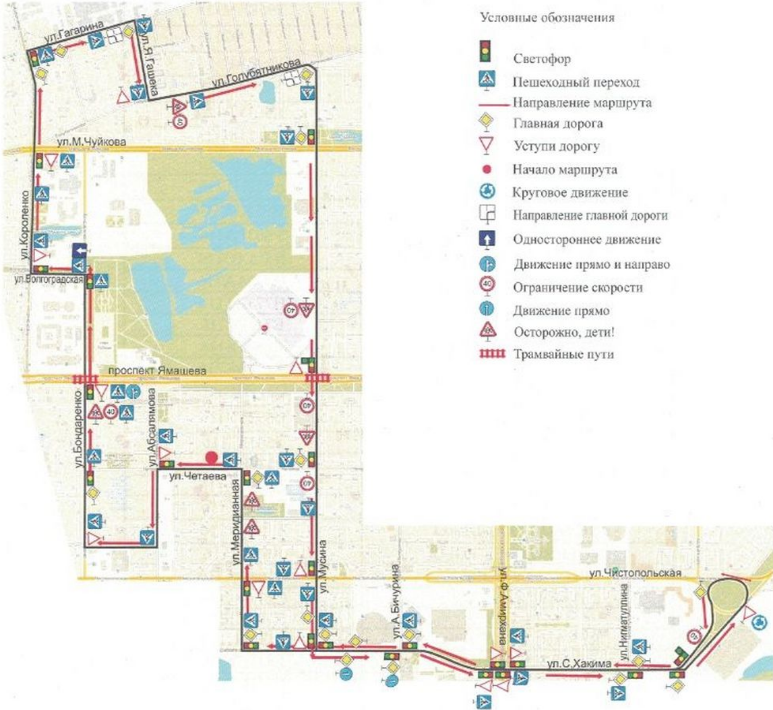
Схема учебного маршрута №7