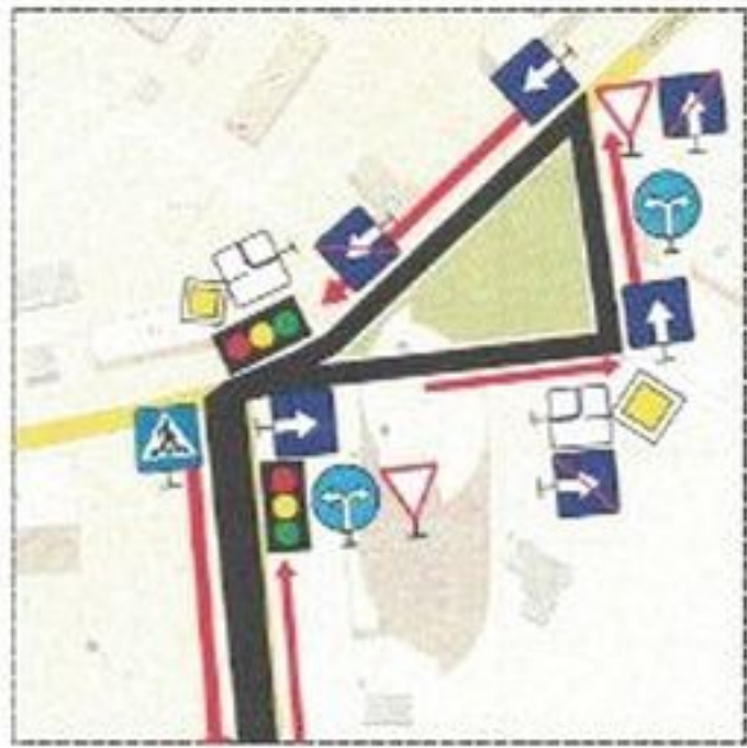
Схема учебного маршрута №4

Период действия с "01" 11 2021 г. по "31" 12 2021 г.